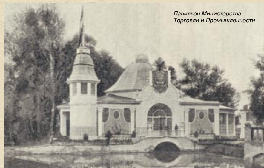
Павильон Министерства Торговли и Промышленности