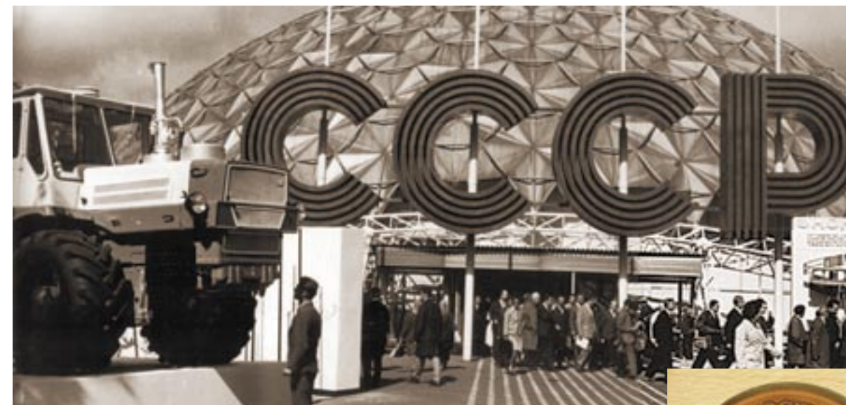
Павильон в Сокольниках

Особое место в истории выставочной деятельности нашей страны и «Экспоцентра» занимает международная отраслевая выставка «Химия», проведенная по инициативе министра химической промышленности СССР Л.А. Костандова в 1965 году. Впоследствии она была первой из российских выставок, зарегистрированных Всемирной ассоциацией выставочной индустрии (UFI). Произошло это в 1975 году. Сегодня она стала базовым смотром химической промышленности и науки России.