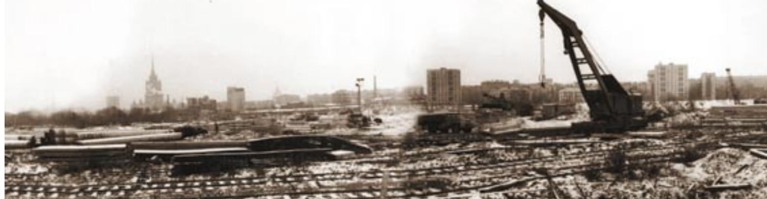
Строительная площадка на месте будущего «Экспоцентра», 1970-е годы.

Заметным событием в жизни СССР стала крупная международная выставка «Стройдормаш» на стадионе «Лужники» в 1964 году. На выставочной площади 54 тыс. кв. м (нетто) 377 фирм из 20 стран мира продемонстрировали передовую технику и технологии для проведения дорожно-строительных работ. Соорганизатором выставки выступил Государственный комитет строительного, дорожного и коммунального машиностроения при Госстрое СССР – ведущее отраслевое ведомство, участие которого значительно повысило статус мероприятия.