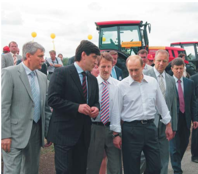
Выставка-демонстрация «День российского поля-2007». Справа-налево: Владимир ПУТИН, Алексей ГОРДЕЕВ и Магомед МУСАЕВ осматривают экспозицию выставки