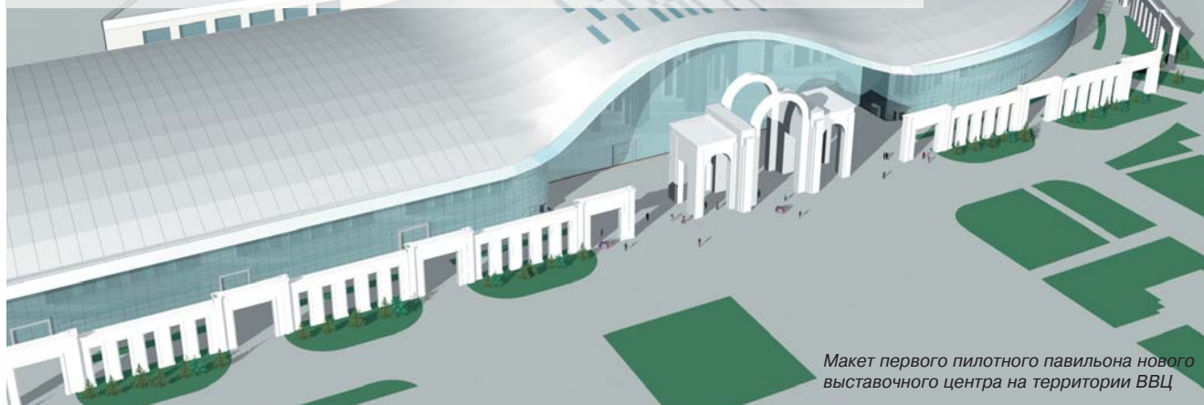
Макет первого пилотного павильона нового выставочного центра на территории ВВЦ