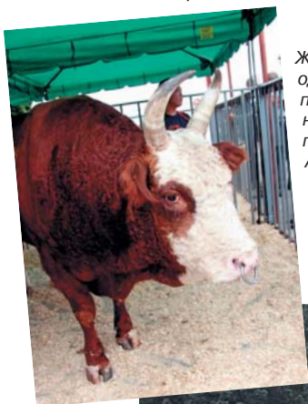
Животноводство – одно из направлений приоритетного национального проекта РФ «Развитие АПК». На выставке «Золотая Осень» ускоренному развитию животноводства уделяется особое внимание

Наша любимая выставка в этом году станет незабываемым событием!