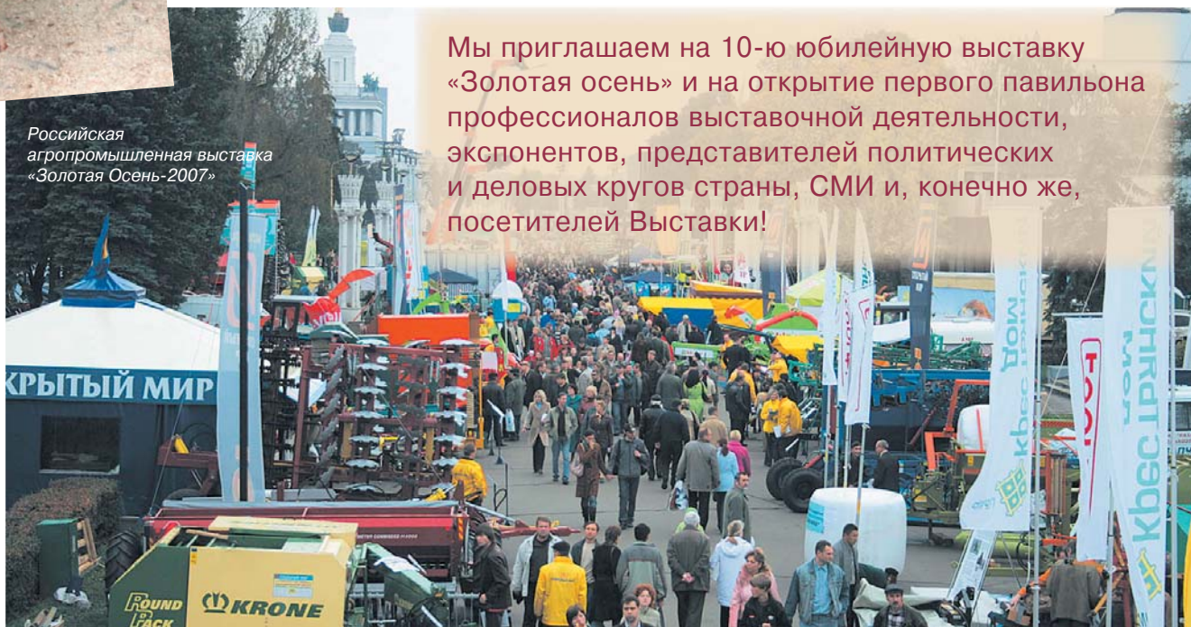
Российская агропромышленная выставка «Золотая Осень-2007»

Мы приглашаем на 10-ю юбилейную выставку «Золотая осень» и на открытие первого павильона профессионалов выставочной деятельности, экспонентов, представителей политических и деловых кругов страны, СМИ и, конечно же, посетителей Выставки!