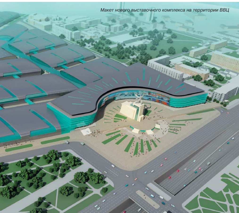
Макет нового выставочного комплекса на территории ВВЦ

Деятельность менеджмента Всероссийского выставочного центра получает положительную оценку и одобрение Правительства Москвы и федеральных властей. Мы благодарны мэру Москвы Юрию Михайловичу Лужкову за то, что он активно поддержал нашу инициативу по строительству на территории ВВЦ нового выставочного комплекса.