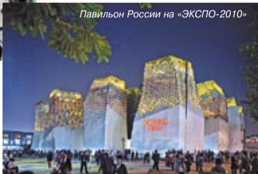
Павильон России на «ЭКСПО-2010»