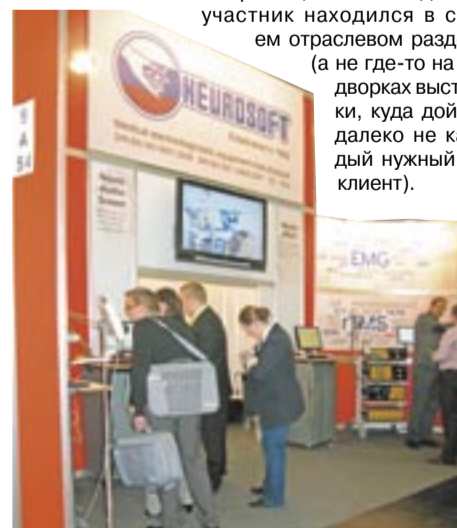
Самостоятельный стенд компании «Нейрософт» из Иваново (производитель медицинского оборудования для функциональной диагностики и нейрофизиологии) в павильоне № 9 – вот где действительно было не продохнуть

Особенностью нынешней выставки стало «разнообразие» национальных экспозиций разных стран. Если несколько лет назад все они компактно располагались в двух павильонах, а в остальных пятнадцати находились тематические экспозиции, посвященные определенной медицинской специализации, то теперь небольшие национальные стенды Франции, Кореи, Израиля, и уж, конечно, в самом большом количестве – Китая, находились почти во всех тематических павильонах. Можно сказать, что национальные экспозиции делились таким образом, чтобы каждый их участник находился в своем отраслевом разделе (а не где-то на задворках выставок, куда дойдет далеко не каждый нужный им клиент).