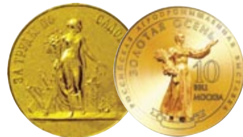
Медаль Российского Императорского Общества садоводства, выдаваемая на выставках, и медаль выставки «Золотая Осень-2010»

Сегодня России так же нужно национальное выставочное издание, публикующее максимально достоверную информацию о наших выставках и выставочном рынке, поднимающее ключевые вопросы развития отрасли, как и век назад. По сути «Удача-Экспо» решает