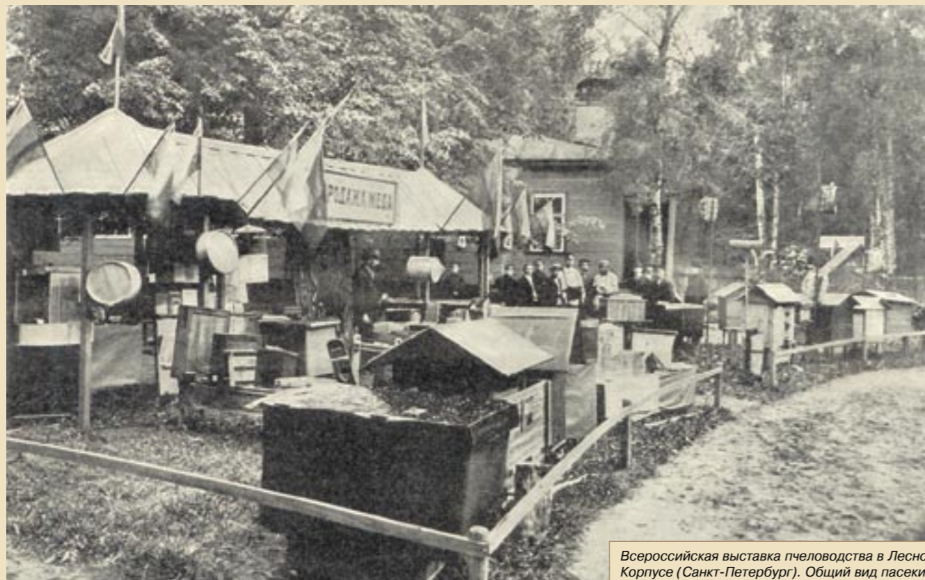
Всероссийская выставка пчеловодства в Лесном Корпусе (Санкт-Петербург). Общий вид пасеки и части сада Русского Общества Пчеловодства