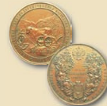
Медаль Бессарабской сельскохозяйственной выставки в Кишиневе 1903 года