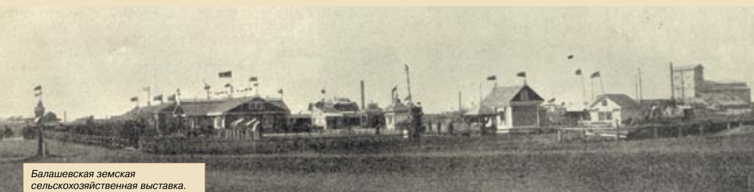
Балашевская земская сельскохозяйственная выставка. Общий вид

только стоят названия их профессий – резалки и солильщицы!) занимались обычным своим ремеслом – резали и солили рыбу. Так был устроен стенд богатейшего рыбопромышленника Ф.И. Базилевского, владельца Синеморских рыбных промыслов в Астраханской губернии, раскинувшихся на 200 000 десятин водного пространства. Думается, и сегодня он стал бы сенсацией на любой «рыбной» выставке.