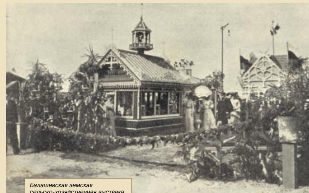
Балашевская земская сельскохозяйственная выставка. Отдел птицеводства