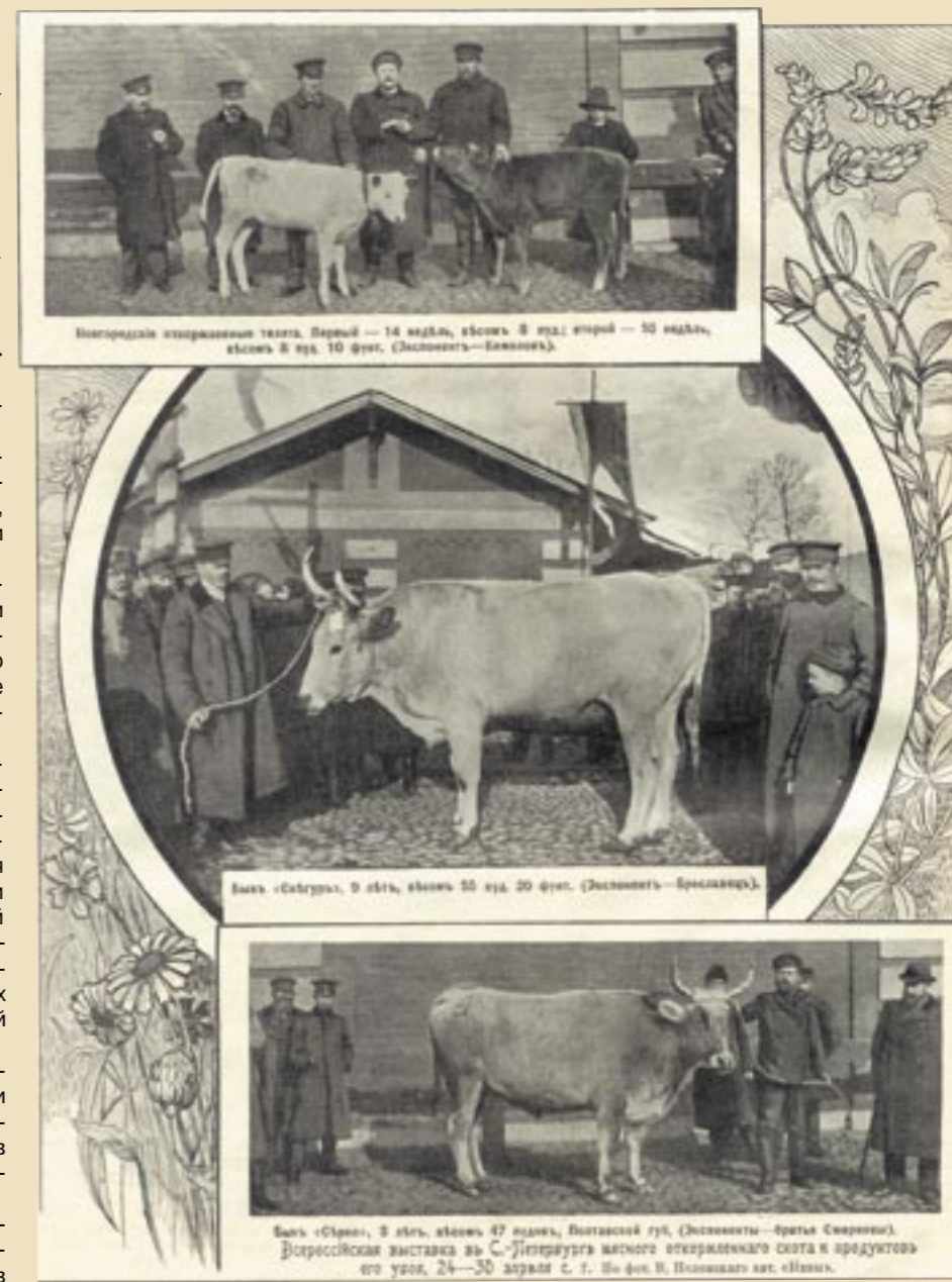
«Нива», № 20, 1908 год

3. Главное – себя показать! Разумеется, и в те времена проходили специализированные выставки, где определяющую роль в формировании