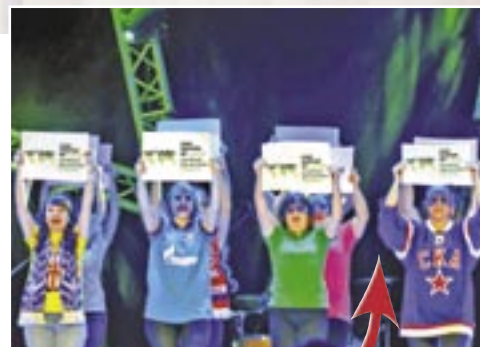
с логотипом GED-2016, фото (фрагмент).

Первое место – «ЭФ-Интернэшнл» за фотографию молодых специалистов компании, находящихся на сцене с высоко поднятыми листами бумаги