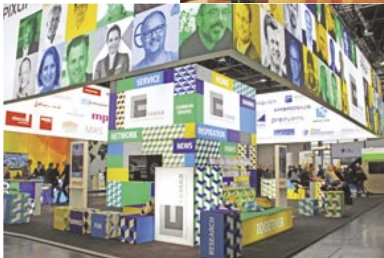
Стенд компании FAMAB – наглядное воплощение «наступления света».