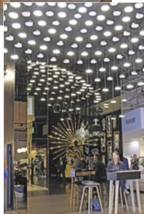
В разделе Lighting можно было видеть уникальное многообразие современных светильников