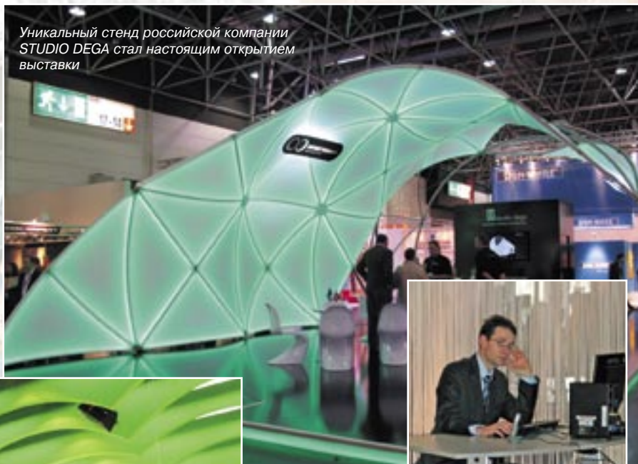
Уникальный стенд российской компании STUDIO DEGA стал настоящим открытием выставки

– EuroExpo: выставочные стенды, конструкции и технологии, ди-