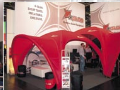
Надувные палатки X-GLOO