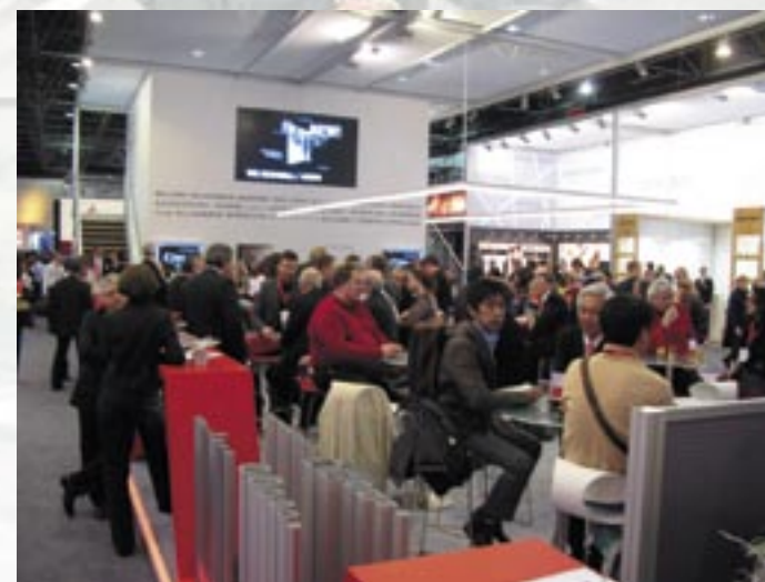
Людское море – покупатели конструкций OKTANORM