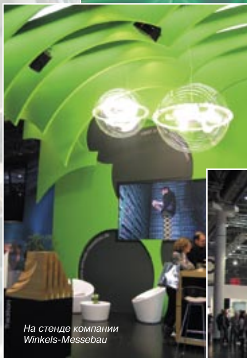
На стенде компании Winkels-Messebau