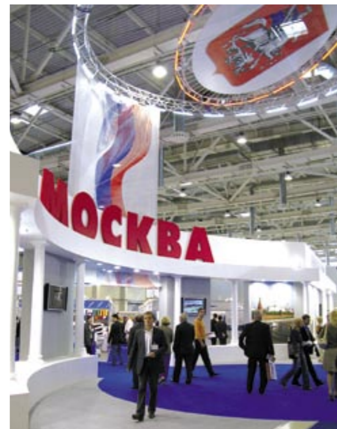
Коллективная экспозиция Москвы