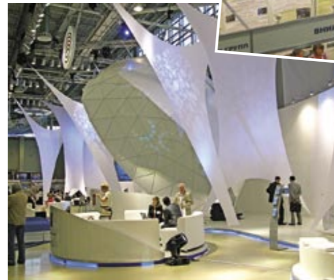
Центральная экспозиция Министерства образования и науки России, Роснауки и Рособразования