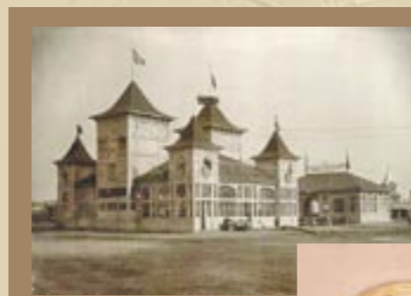
Павильон «Международной компании жатвенных машин в Америке» (вверху). Новогодняя открытая и настенный календарь компании на 1913 год

Впрочем, большинство экспонентов, построенных собственными павильонами, ограничилось традиционным художественным решением: небольшим зданием, богато украшенным снаружи и декорированным внутри, надстроенным либо дополненным разного рода архитектурными деталями, оригинальными окнами и строительными конструкциями.