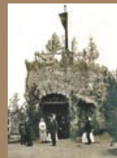
Павильон «Хуторок барона В.Р. Штейнгеля»