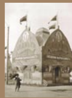
Павильон компании по производству газовых и электрических машин И. Л. Динга (Москва)