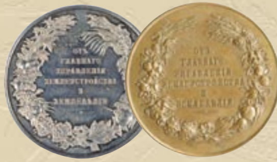
Наградные медали Главного Управления землеустройства и земледелия

Программа съезда охватывала все стороны развития молочного хозяйства и маслоделия в Сибири: общее состояние отрасли, новые технологии, организация производства, качество исходного сырья и готовой продукции, борьба с фаль-