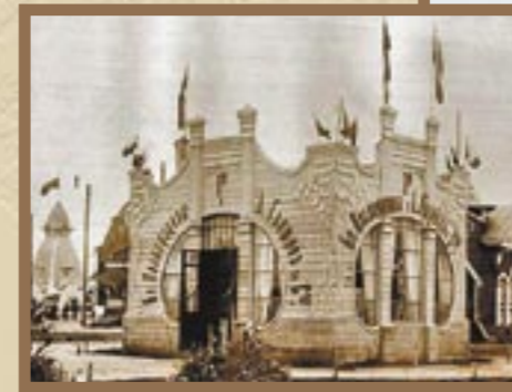
Павильон Фабрично-торгового товарищества «Братья Овсянниковы и А. Ганшин с С-ми»