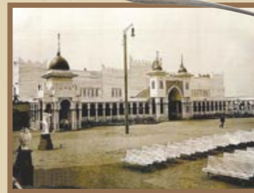
Здание театра и ресторана.