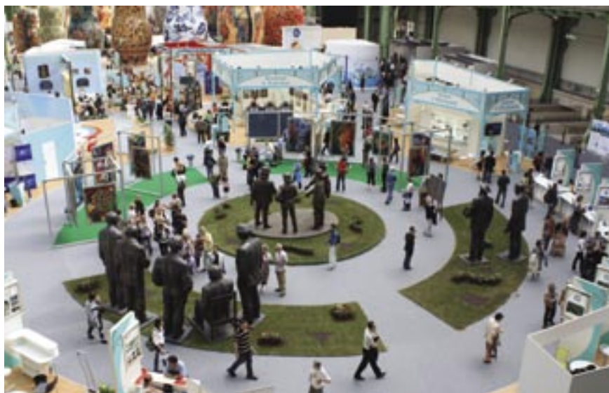
Российская национальная выставка в Париже в 2010 году

В повестке дня один вопрос – обсуждение отчетов федеральных министерств об организации единых российских экспозиций с частичным государственным финансированием на зарубежных выставках в 2010 году. Отчет был представлен в Правительство России в начале марта текущего года. Будет рассматриваться также методика определения эффективности российского участия в этих мероприятиях.