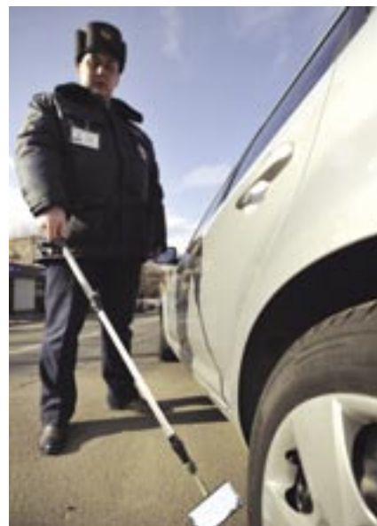
Проверка автомобиля на контрольно-пропускном пункте.

В общем, задачи очень серьезные, но и возможности решать их у нас имеются.