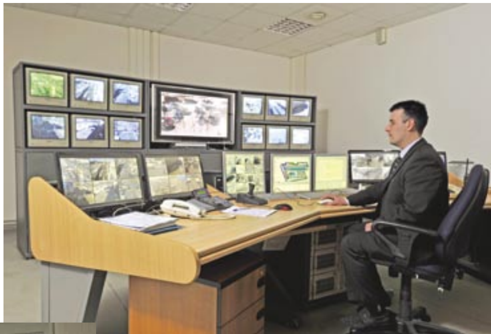
Система видеонаблюдения территории «Экспоцентра». Главный пункт контроля

– Надо понимать, что частное охранное предприятие, обеспечивающее общую безопасность на комплексе, не может нести ответственность за сохранность оборудования и материальных ценностей всех участников выставки.