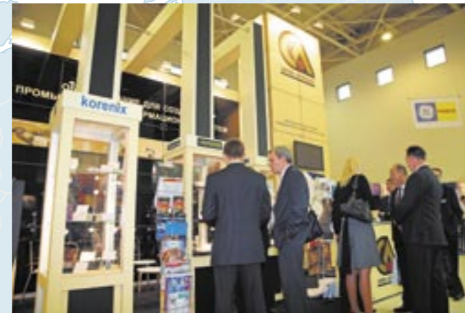
«Передовые Технологии Автоматизации. ПТА-2008» в Москве

В течение последних пяти лет мы фиксировали положительную динамику. Ежегодно график наших проектов прирастал выставкой или конференцией, и все они становились традиционными. Каждый следующий специализированный форум был лучше предыдущего – повышались оценки экспонентов; возросли количественные и статусные показатели: площадь, число участников, перечень поддерживающих официальных структур, насыщенность деловой программы.