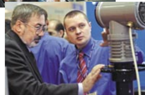
Демонстрация образцов продукции на «ПТА» в Москве

Безусловно, это сверхскоростное движение кризис замедлил. Экспоненты сокращают площадь стендов, вместе мы ищем альтернативные, экономичные формы сотрудничества. И у клиентов, и у нас, есть понимание того, что самое страшное проявление кризиса – это недоверие. Непосредственный контакт, получение обратной связи от Заказчика, возможность посмотреть в глаза партнеру это – неоспоримые достоинства специализированных форумов. Поэтому участие в выставках актуально как никогда. Особенно для компаний, планирующих долгосрочное присутствие на рынке.