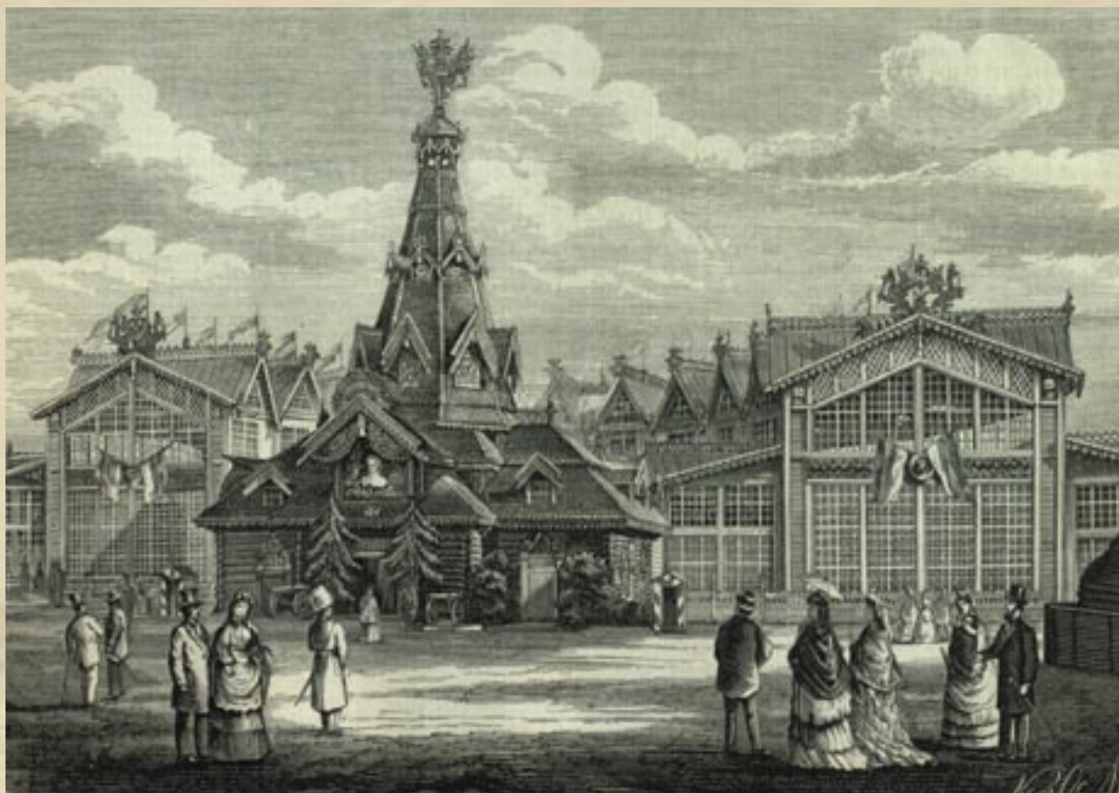
Московская Политехническая выставка. Здание Военного отдела. Главный вход (журнал «Всемирная иллюстрация», 1872)

цветов, украсили флагами многочисленные павильоны, слетели чехлы с выставленных предметов, и посетителю является полная возможность ознакомиться с задачей Выставки. Павильоны будут пополняться, но и того, что в них есть теперь, достаточно для того, чтобы составить себе цельное понятие об этом громадном предприятии.