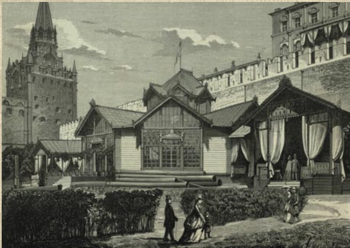
Московская Политехническая выставка. Павильон Лесного отдела (журнал «Всемирная иллюстрация», 1872)

Посетители не могли требовать сдачи при покупке входного билета, поскольку кассир, выдававший билет, не имел права... брать в руки деньги – монеты и банкноты опускались в запертые ящики