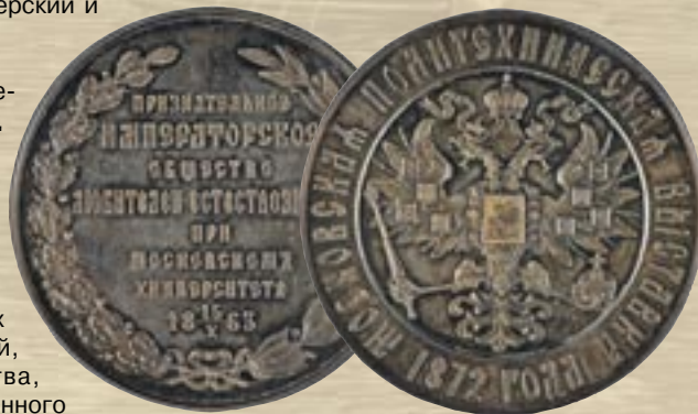
Серебряная медаль Императорского Общества любителей естествознания, антропологии и этнографии при Московском университете. Московская Политехническая выставка 1872 года

Общее число посетителей, оплативших входной билет, составило 350 536 человек. Входной платы с них выручено 197 713 руб. 60 коп.