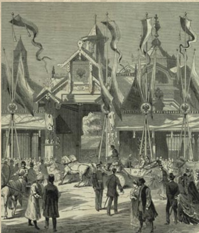
Московская Политехническая выставка. Главный вход с Воскресенской площади

После Высочайшего одобрения инициативы профессоров Императором Александром II был создан Комитет по устройству выставки во главе с князем С.М.Голицыным, который вел всю практическую работу.