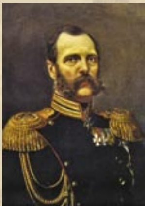
Его Величество Государь Император Александр II

К 150-летию Политехнической выставки 1872 года в Москве