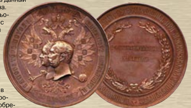
Памятная медаль Московской Политехнической выставки 1872 года

Выставка открылась в день юбилея – 30 мая 1872 года, и продолжила работу до 1 сентября. Она собрала около 12 000 экспонентов, в том числе 2000 иностранных, и не менее 750 000 зарегистрированных посетителей