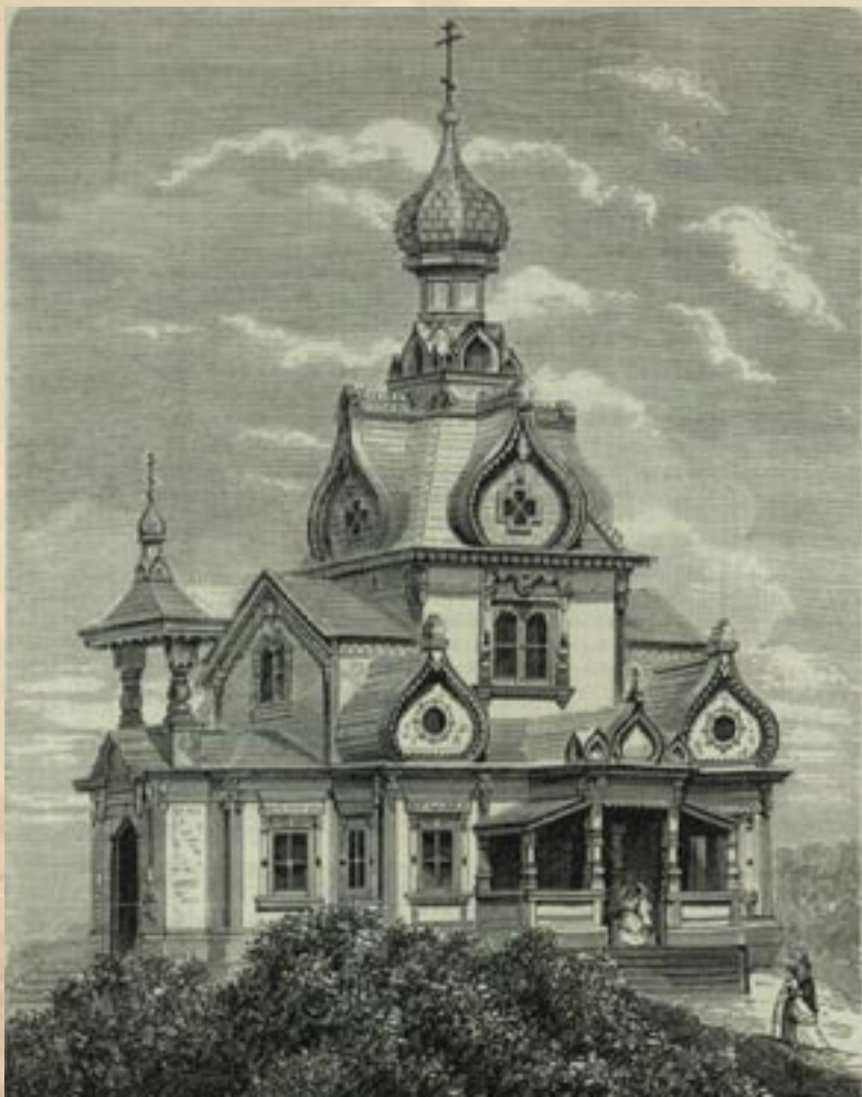
Московская Политехническая выставка. Отдел домоводства. Сельская церковь (журнал «Всемирная иллюстрация», 1872)

На Политехнической выставке впервые в России появился турникет при входе, соединенный со специальным механизмом для подсчета количества проходящих. Благодаря этому в газетах ежедневно печатались предельно точные сводки о количестве гостей