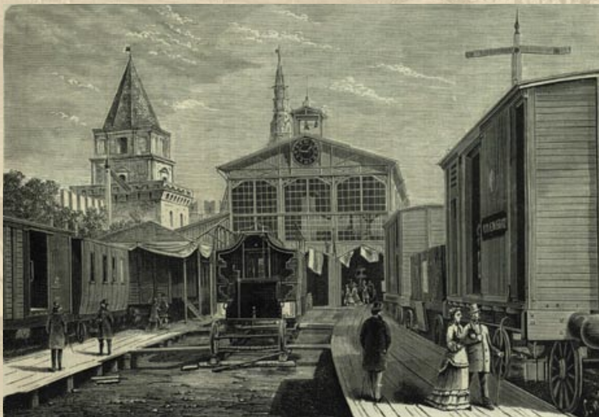
Московская Политехническая выставка. Железнодорожный отдел (журнал «Всемирная иллюстрация», 1872)

«С раннего утра начала наполняться Выставка членами Комитета и Комиссий, депутатами, приглашенными лицами, экспонентами: все спешили на торжества в праздничной одежде, с веселыми лицами, с сочувствием к удавшемуся предприятию. Те, кто еще накануне вечером был на Выставке, не узнавал ее: в такой степени она вдруг убралась, очистилась, украсилась в одну ночь: как бы волшебством раскинулись по саду ковры