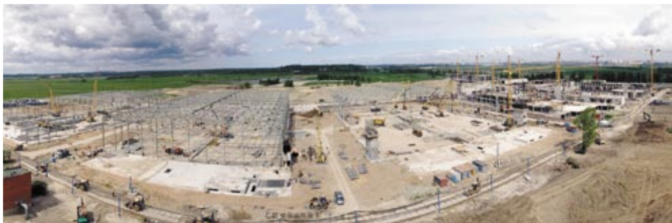
Строительство нового международного конгрессно-выставочного комплекса в Санкт-Петербурге идет полным ходом

На фото сверху: в «Ленэкспо» всегда многолюдно: выставки «Энергетика и электротехника» и «Зоосфера», 2012 г.