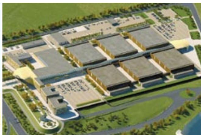
Что увидим в 2014 году? Вход в конгресс-центр (слева) и общий вид конгрессно-выставочного комплекса (справа)