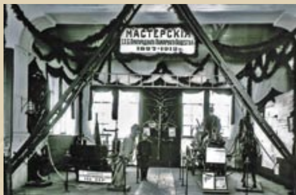
Экспозиция мастерских Петербургского Пригородного Пожарного Общества