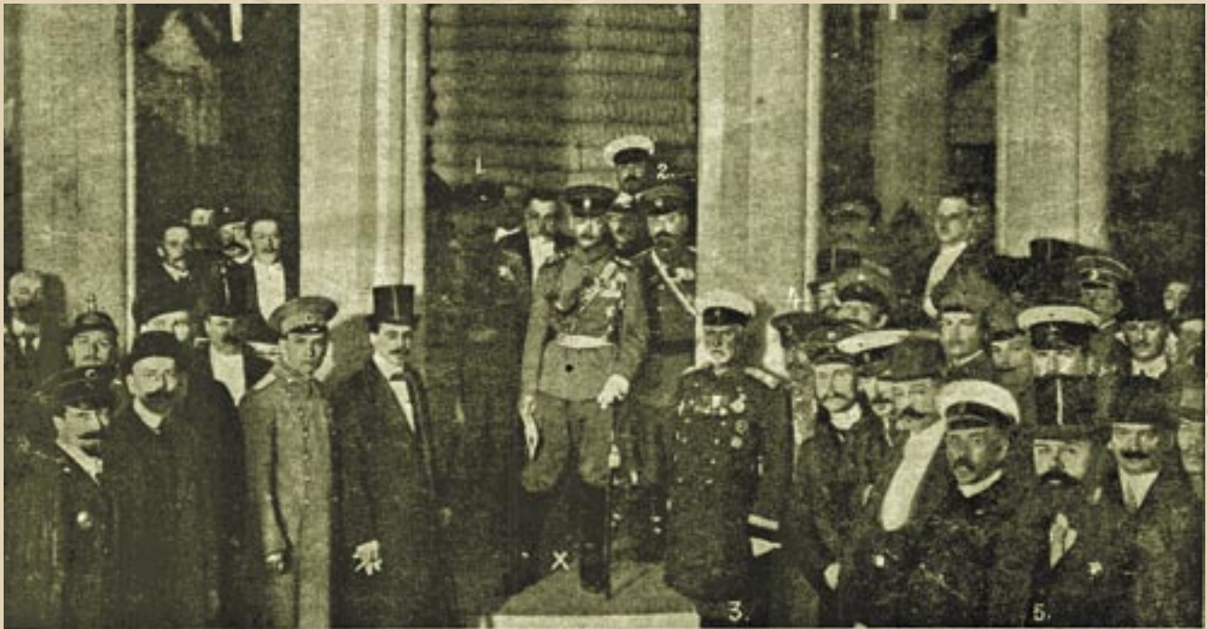
(X) Его Императорское Высочество Великий Князь Андрей Владимирович; 1) полковник Д. П. Струков; 2) помощник спб. градоначальника инженер В. В. Лысого; 3) член Совета Императорского Российского Пожарного общества Д. Н. Бородин; 4) спб. бригадир-майор А. В. Литвинов; 5) гласный спб. гер. думы Н. П. Зелено.

Общая фотография на церемонии торжественного открытия Международной выставки противопожарных мер и страхования от огня 1912 года