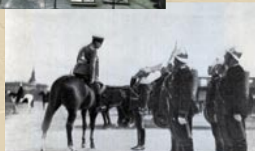
Смотр пожарных на Марсовом поле, 20 мая 1912 года