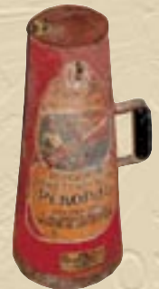
Огнетушитель «Рекорд», начало XX века

Но не только промышленные гиганты удивляли гостей.