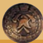
Нагрудный знак И.Р.П.О., пуговица с мундира и пожарная каска со знаком Общества

Одной из самых интересных стала экспозиция Новгородского губернского земства, где располагались огнестойкие здания жилых построек и школ, предназначенные для сельской местности.