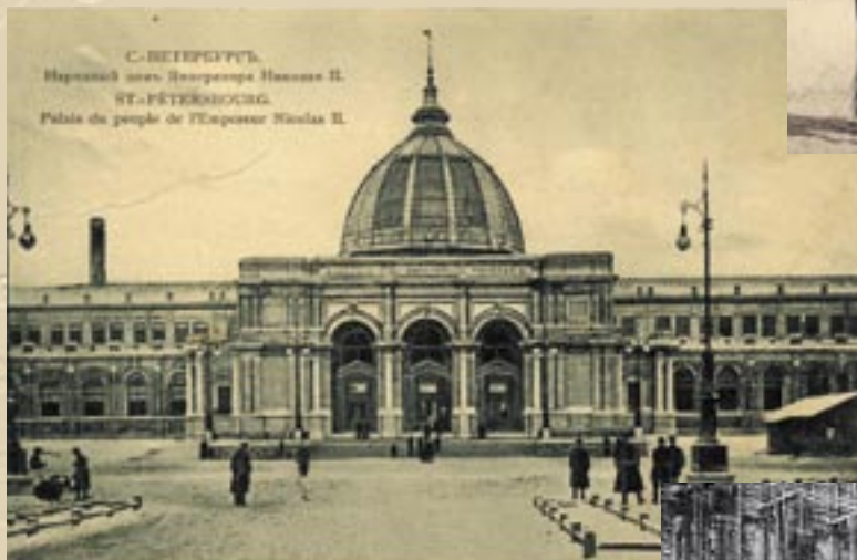
Народный Дом Императора Николая II – общий вид и фотография сцены нового здания после пожара, случившегося в январе 1912 года