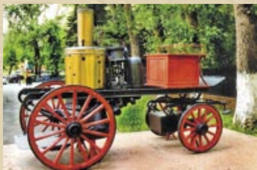
Паровая пожарная машина – насос производительностью 1200 литров воды в минуту. Машина изготовлена фирмой «Густав Лист» в России в 1912 году

Здесь находилось образцовое в пожарном отношении здание кинематографа, построенное из огнестойких материалов. Рядом «трудилась» полевая офицерская кухня, топившаяся асбестом, пропитанным керосином – специальными «асбестовыми дровами», призванными заменить обычные дрова и иной горючий материал в полевых условиях, когда их крайне трудно достать.