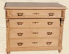
Мебель в стиле Jugendstil, Германия, начало XX века.