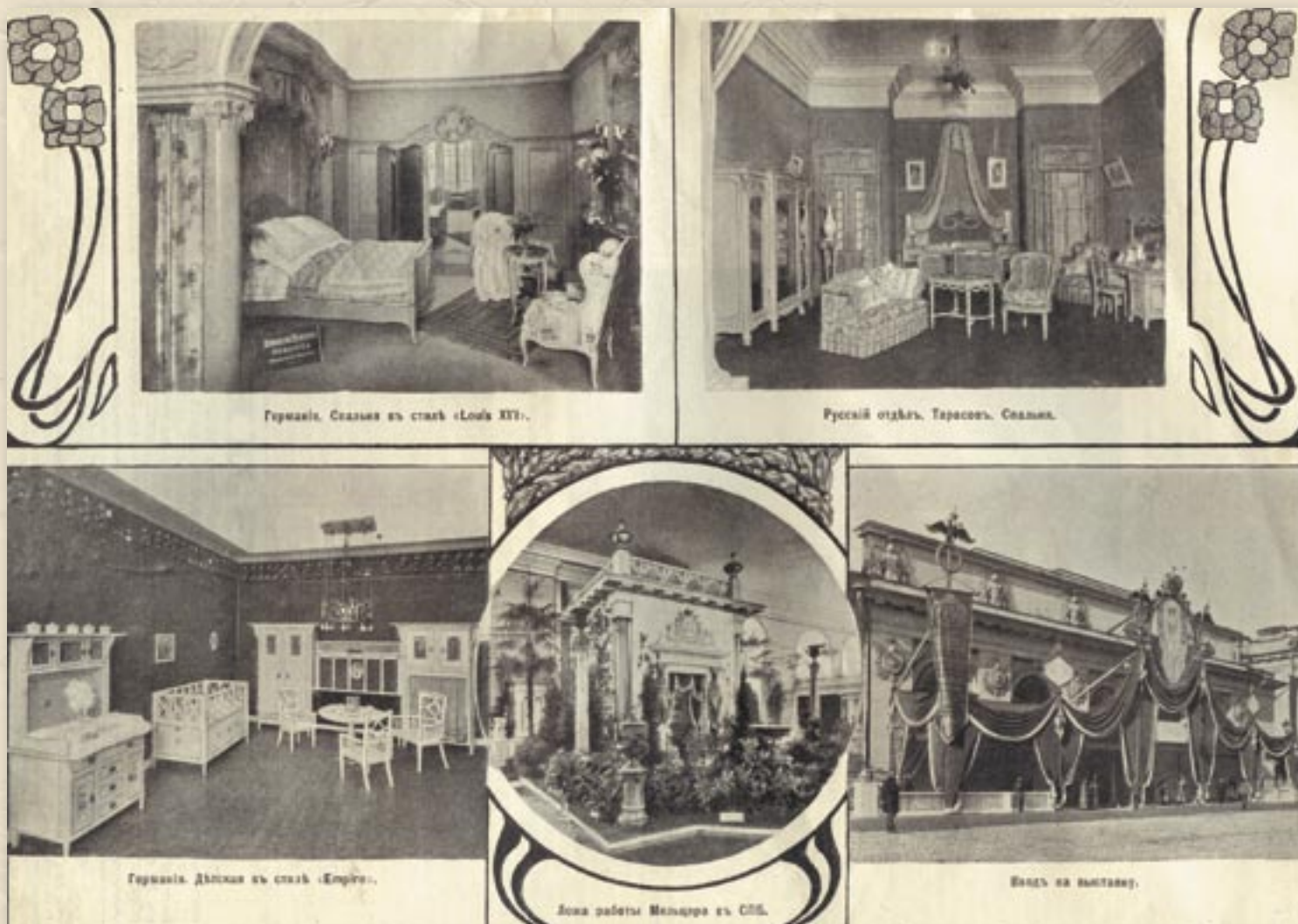
Международная Художественно-промышленная выставка мебели 1908 года

«Шведский отдел тем и замечателен, что наглядно учит экономии в распределении эффектов. Для картин и вообще художественных предметов нет, быть может, злейшего врага, чем сами эти картины или предметы – в чрезмерном количестве или кричащем сочетании» (из статьи журналиста)