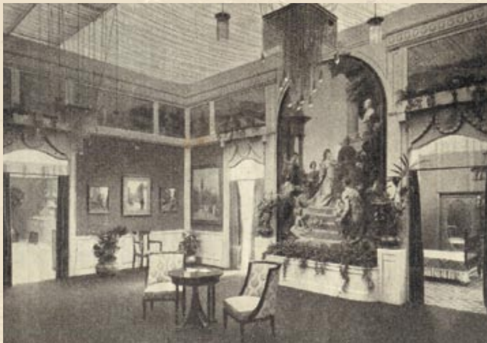
Международная Художественно-промышленная выставка мебели 1908 года Приемная зала из Вены в стиле «Empire»

К 100-летию первой международной специализированной выставки мебели в России