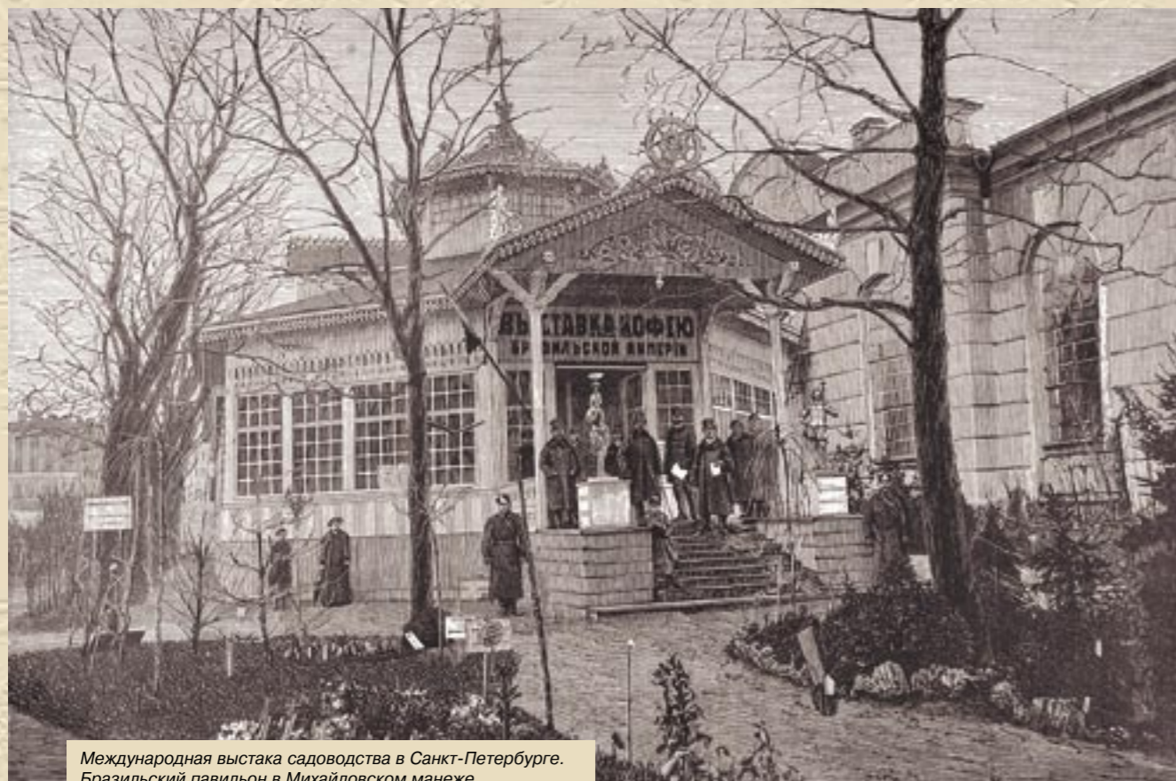
Международная выставка садоводства в Санкт-Петербурге. Бразильский павильон в Михайловском манеже

К юбилею Международной выставки садоводства и Выставки кофе Бразильской Империи 1884 года в Санкт-Петербурге