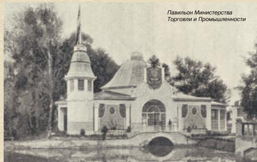
Павильон Министерства Торговли и Промышленности

Павильон города Санкт-Петербурга увенчали шпилем с силуэтом кораблика. Городские власти представили масштабные планы преобразования столицы. Посетители могли видеть чертежи планируемых к строительству объектов: каменного Дворцового моста, Охтенской больницы и иных городских сооружений «к несчастью, только не из действительности, а из «страны испанских замков» 5 – иронизировал журналист. Сегодня, век спустя, с ним можно отчасти согласиться: одним из показанных тогда проектов стал план устройства нового Екатерининского проспекта на месте засыпанного Екатерининского канала (ныне – канала имени Грибоедова). Как известно, в то время один Екатерининский проспект уже существовал – в 1903 году в честь 200-летия Санкт-Петербурга этим именем назвали бывшую Охтенскую дорогу на окраине города. Рядом, классифицированная по эпохам, представляла история городского освещения, начиная с