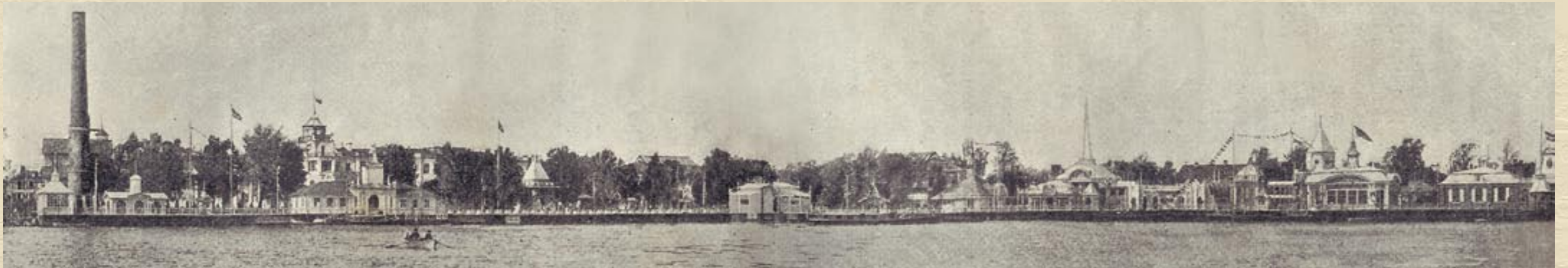
Общий вид Международной художественно-строительной выставки 1908 года