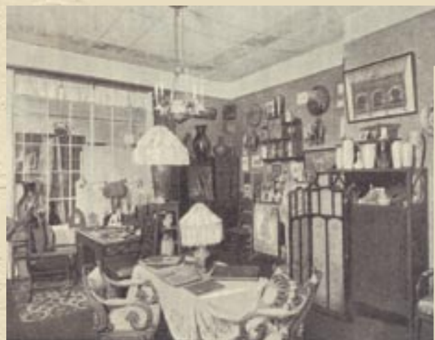
Кабинет Московского Строгановского училища