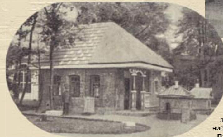
Огнестойкие постройки Новгородского губернского земства

Главный Вход представал в образе Триумфальных ворот в честь Полтавской победы. Здание имело небольшие колоннады, обнимавшие примыкавшую площадь полукругом. Над входными воротами высилась восьмиугольная башня, увенчанная статуей работы скульптора А.Т. Матвеева. На стенах установили четыре живописных панно: на башне – по эскизам Л.С. Бакста, внизу, на крыльях здания, – по эскизам Е.Е. Лансере.