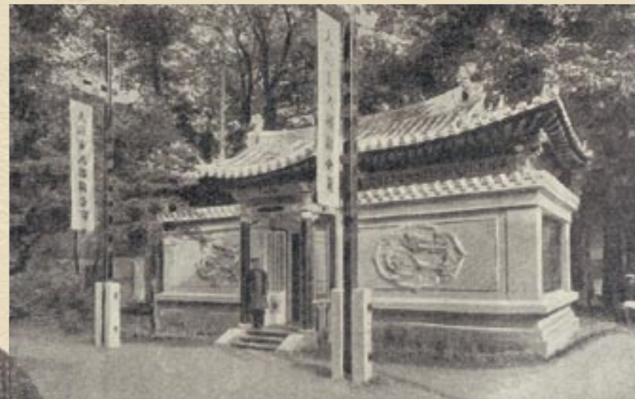
Павильон Восточной Китайской железной дороги