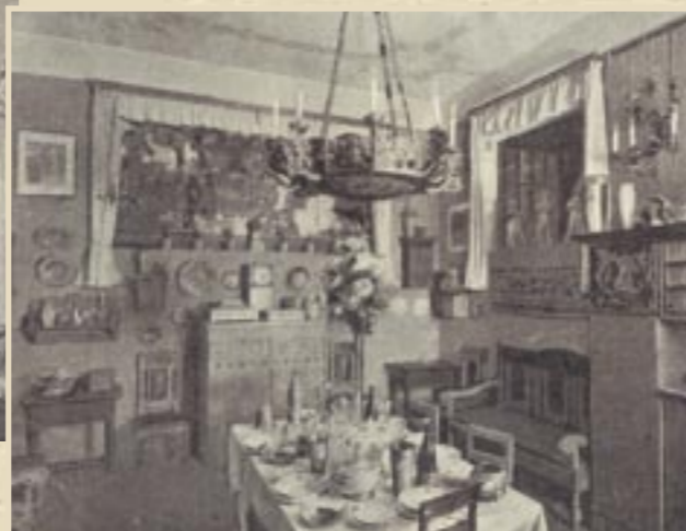
Столовая Московского Строгановского училища

небольших масляных и свечных фонарей и заканчивая электрическими гигантами.