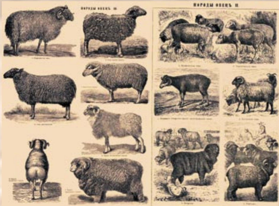
«Энциклопедический словарь Ф.А. Брокгауза и И.А. Ефрона». Иллюстрации: породы овец.

Согласно решению выставочного комитета, плата за места под экспонаты взиматься не будет, равно как и потребная вода и электричество для машин будут предоставлены бесплатно. Выставка будет носить показательный характер без выдачи наград за лучшие экспонаты. Ответы от приглашенных фирм, организаций и учреждений предполагается получить в самом непродолжительном времени и во всяком случае не позже 1 августа. 3