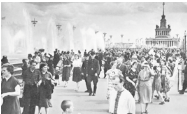
В воскресный день - не протолкнуться ...