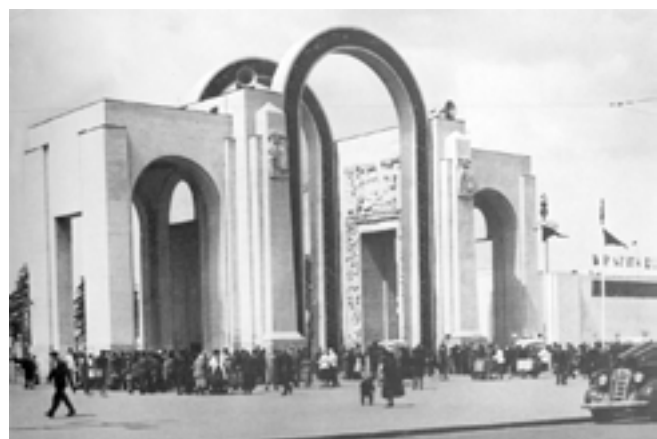
ВСХВ в 1939 году: главный вход на Выставку и главный павильон

Награды ВСХВ ценились чрезвычайно высоко. Были предусмотрены 5000