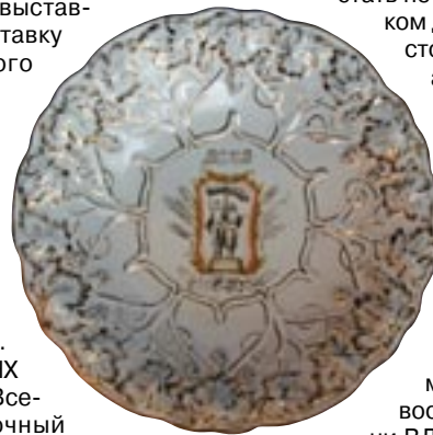
Вверху – памятная рельефная фаянсовая тарелка «ВСХВ»

И весь этот опыт может и должен быть востребован в новой жизни ВДНХ.