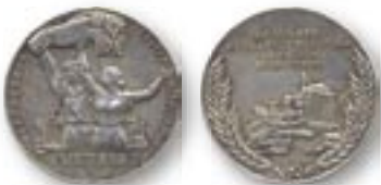
Большая серебряная медаль ВСХВ

дипломов: 1000 дипломов первой степени, к которым «прилагались» премия 10 000 рублей и легковой автомобиль, и 1000 дипломов второй степени, за них полагалось 5000 рублей и мотоцикл. Помимо этого, выдавались 3000 золотых и 18 000 серебряных медалей. За первые три месяца выставку посетили более 3,5 миллионов человек; за пять месяцев 1940 года – 4,5 миллиона гостей.