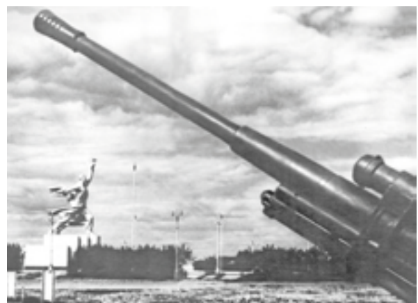
В годы войны на ВСХВ располагались зенитные установки