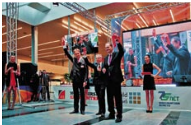
Открытие выставочного центра «Новосибирск Экспоцентр» и первой на этой площадке выставки SibBuild 2012

Это современная выставочная площадка, которая позволит проводить мероприятия на качественно более высоком техническом и организационном уровне, чем раньше. Для экспонентов и посетителей здесь созданы комфортные условия работы. Первая выставка, которая прошла на новой площадке — строительная и ин-