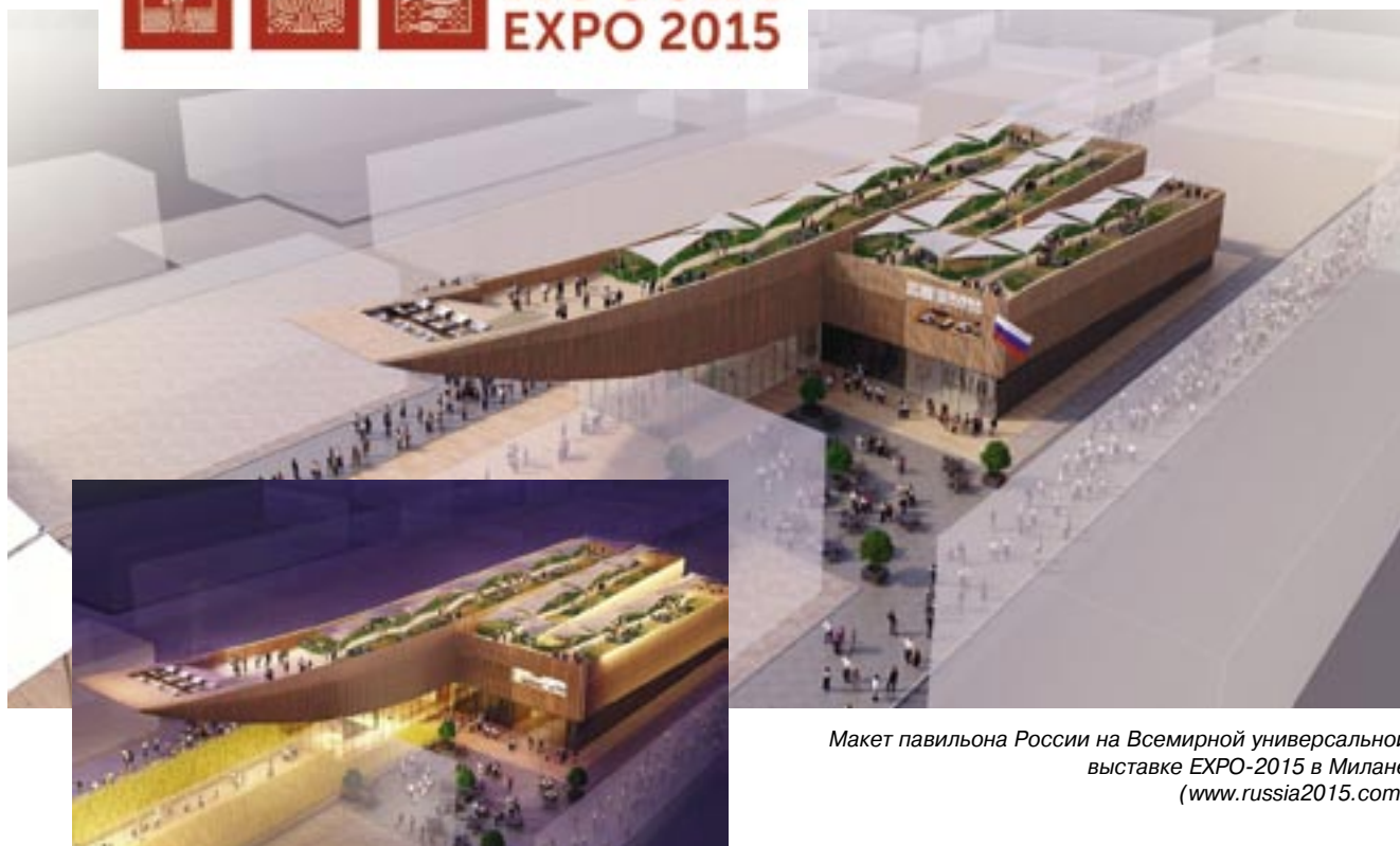
Макет павильона России на Всемирной универсальной выставке EXPO-2015 в Милане