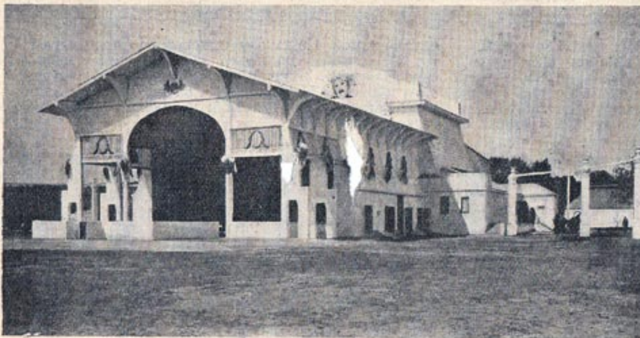
Театръ Суходольскаго на выставкѣ