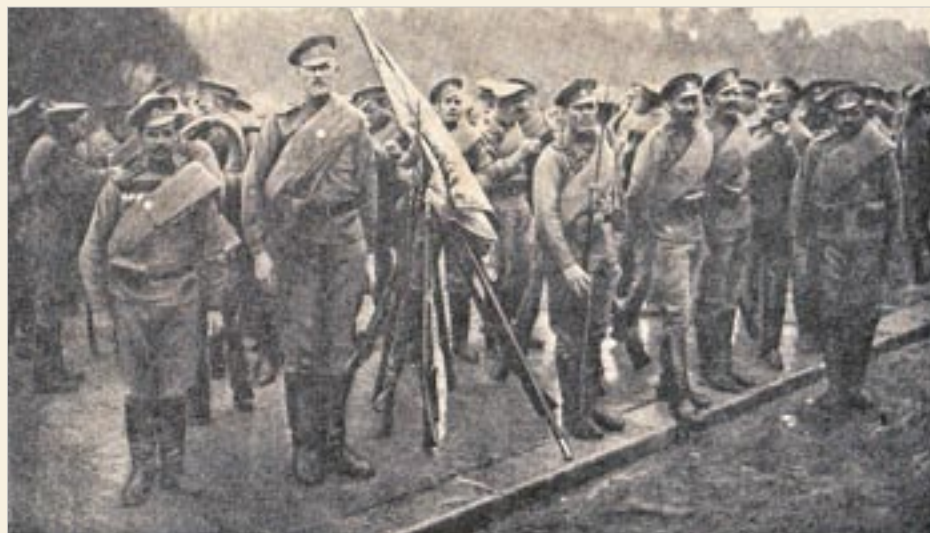
После 19 июля 1914 года главными «посетителями» Ходыньского поля стали офицеры и нижние чины русской армии