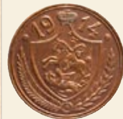
Памятная медаль Всероссийской фабрично- заводской и ремесленной выставки в Москве 1914 года (оборотная сторона)