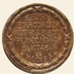
Памятная медаль Всероссийской фабрично-заводской и ремесленной выставки в Москве 1914 года (лицевая сторона)

В русской истории это событие занимает особое место, поскольку речь идет о последней общенациональной выставке Российской Империи – огромной страны, простиравшейся от Варшавы до Сахалина и границ Афганистана.