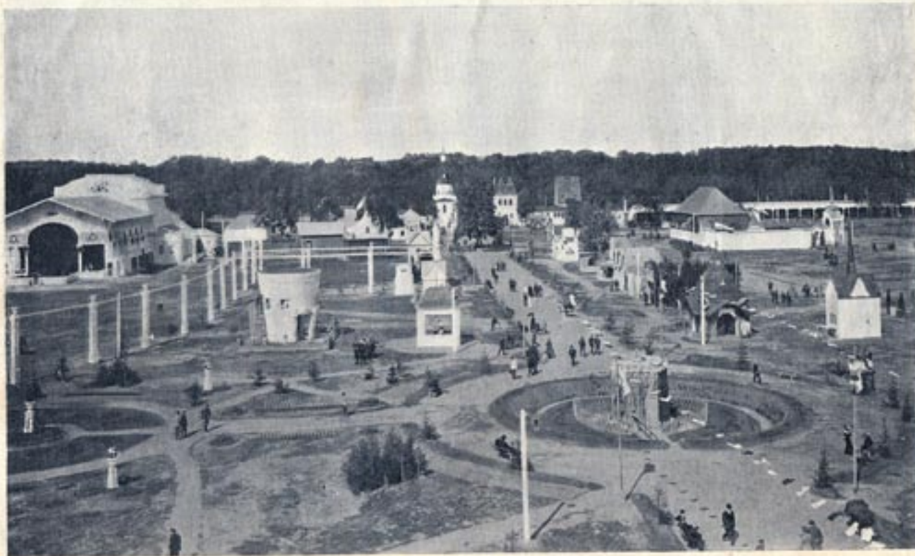
Общий вид выставки.

К 100-летию Всероссийской фабрично-заводской и ремесленной выставки в Москве 1914 года